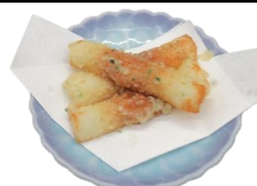
ちくわの磯辺揚げ 350円