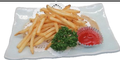
フライドポテト 350円