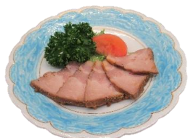
ローストポーク 600円