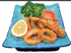
イカゲソ唐揚げ 450円