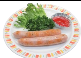
粗挽きウインナー 450円