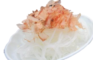
オニオンスライス 300円